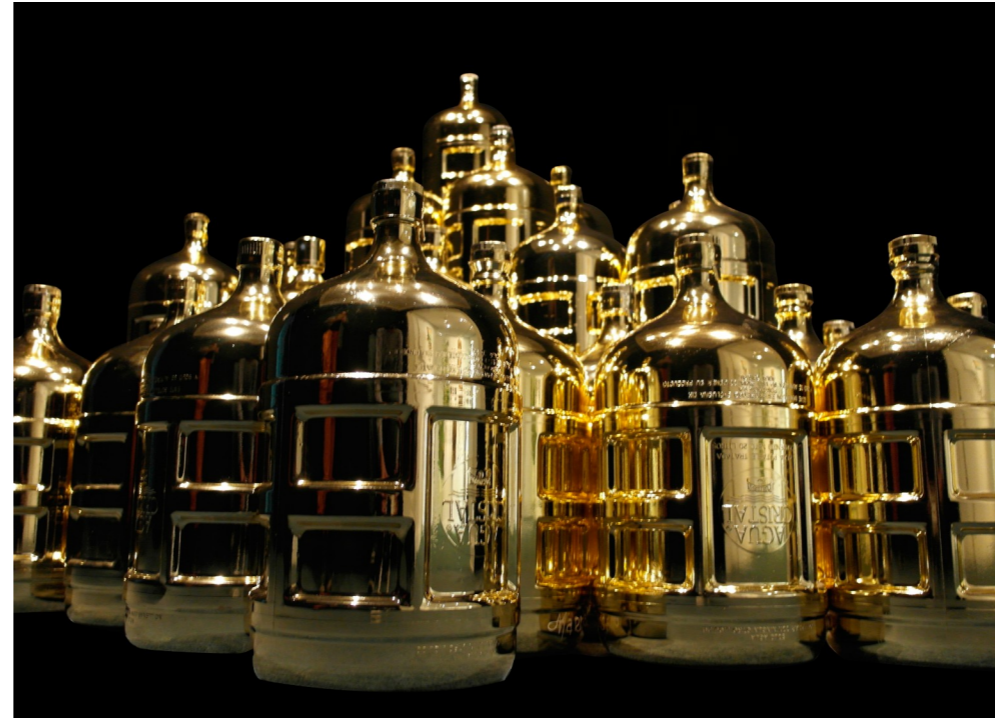
Título: Frailejones Técnica: Instalación Dimensiones: Variables Año: 2017

Estudios a nivel mundial encuentran que al menos dos billones de personas viven en regiones con es trés hídrico. Zonas enteras en el mundo tienen una disponibilidad limitada de agua, como por ejemplo en Europa donde la alta densidad de población es uno de los factores principales que aumentan esta problemática. En otras regiones, hay disponibilidad física del agua, pero no los recursos tecnológicos, técnicos o la infraestructura para el acceso a ella, como lo es el caso del Congo. Y en otras partes del mundo, la explotación desacomodada de otros recursos naturales y el auge de la industrialización sin reglamentaciones gubernamentales que apoyen y regulen el consumo del agua con una verdadera conciencia ecológica, amenaza definitivamente la existencia.