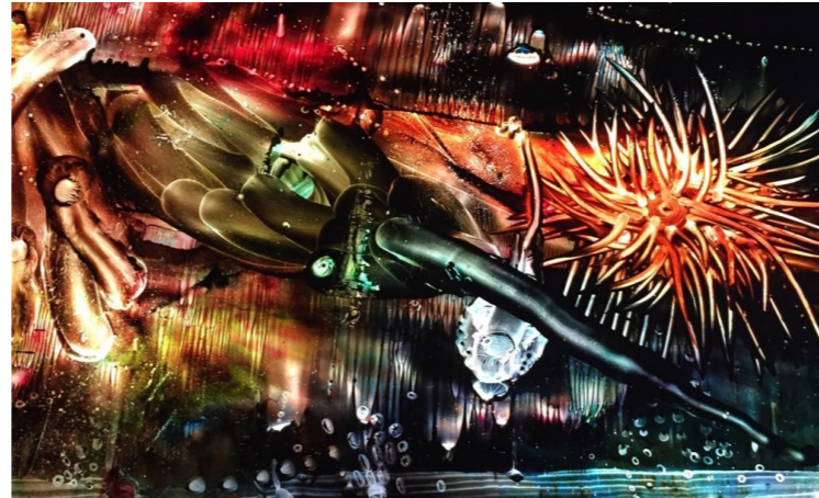
Titulo: Abisales 5 Técnica: Óleo Pictolumínico Dimensiones: 85 x 100 cms Año: 2017