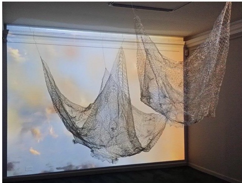
Titulo: Atarraya Técnica: Tejido en Hilos de Acero Dimensiones: Variables Año: 2017