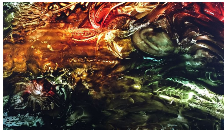
Titulo: Abisales 7 Técnica: Óleo Pictolumínico Dimensiones: 89 x 95 cms Año: 2017