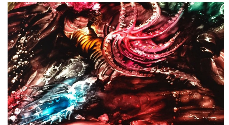
Titulo: Abisales 8 Técnica: Óleo Pictolumínico Dimensiones: 85 x 94 cms Año: 2017