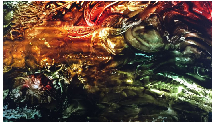
Titre: Abyssales 7 Technique: Huile Pictolumínico Dimensions: 89 x 95 cms Année: 2017