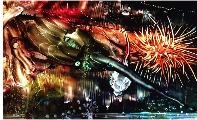
Titre: Abyssales 5 Technique: Huile Pictolumínico Dimensions: 85 x 100 cms Année: 2017